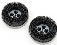
WELLDRAHT - RIFFELBLECH- REINIGUNG