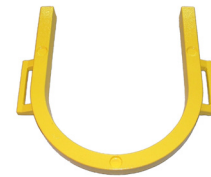
HUFEISENGEWICHT (JE 17 KG)