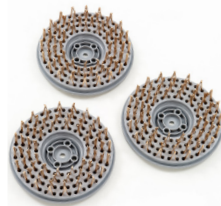
BRONZENÄGEL 18G - FUNKENFREIE BODEN- BEARBEITUNG