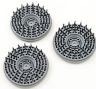
STAHLNÄGEL 18G - BETONBEAR- BEITUNG