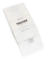
SACS À POUSSIÈRE EN PAPIER