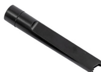
SUCEUR PLAT D'ANGLE