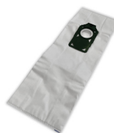
SACS POUR ASPIRATEUR HEPA