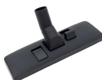
WERKZEUG FÜR TROCKENE BÖDEN