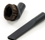
FUGENDÜSE UND STAUBBÜRSTE