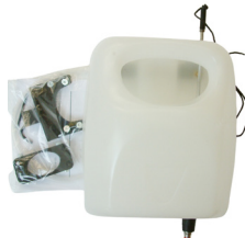
FRISCHWASSER- TANK (5 LITER)