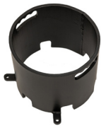
12,5 KG ZUSÄTZLICHES GEWICHT